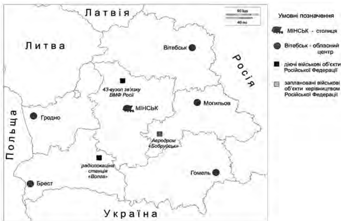
Рис. 2. Військові об'єкти Росії на території Білорусі, складено за [10, с. 21-23]

Вважаємо: тенденції нейтральності керівництва Білорусі ситуативні, але досить сталі й завжди відіграють значну роль у формуванні зовнішньої політики держави. Свідченням того стали відмова визнати квазіреспубліки на території Грузії та України, відсутність незаперечної підтримки Росії в політичному конфлікті з Туреччиною, ЄС і США, а також – налагодження політичного й економічного контакту з цими геополітичними гравцями. Реалізуючи політику багатовекторності й нейтральності , Білорусь має звернути увагу на політико-географічні процеси в нашій державі протягом останнього десятиліття, адже використані Україною для звільнення від залежності методи зробили її більш уразливою перед зовнішніми загрозами. Реалізація нової геостратегії в умовах відповідної політики поліпшить безпекову ситуацію в Центрально-Східній Європі, а розвиток Білорусі стане більш прогнозованим для країн-сусідів та Європейського співтовариства.