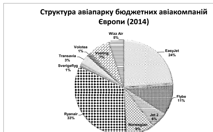
Рис.2. Структура авіапарку бюджетних авіакомпаній Європи (2014)

Зростання обсягу авіаперевезень не відбувається спонтанно, а відштовхується від тих чи інших ядер первинного розвитку. Надалі виникають нові ядра або зони